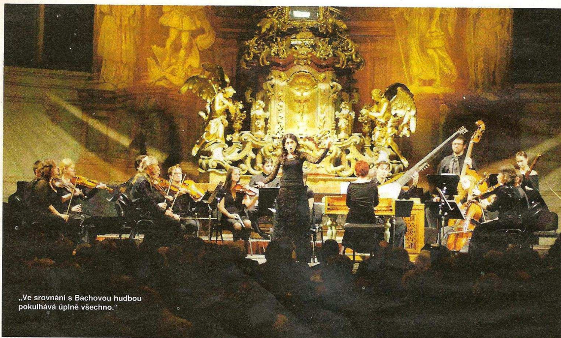
„Ve srovnání s Bachovou hudbou pokulhává úplně všechno.“